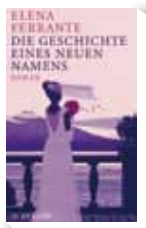
Elena Ferrante, Die Geschichte eines neuen Namens , Suhrkamp

„Ferrantes große Saga geht weiter – und wie! Es ist das Neapel der sechziger Jahre, Lila und Elena sind inzwischen junge Frauen, und sie verzweifeln an ihren Lebensumständen. Doch trotz aller