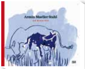
Armin Mueller-Stahl, Die Blaue Kuh , Hatje Cantz

„Ich freue mich sehr über unser neues Liebhaber-Büchlein: Armin Mueller-Stahl hat für Hatje Cantz sein 65 Jahre altes Gedicht Die Blaue Kuh wiederbelebt, das in der DDR zu einem regimekritischen Lied wurde. 20 wundervolle Aquarell- und Kohlearbeiten des Künstlers werden durch den handgeschriebenen Text ergänzt. Das handliche Geschenkbüchlein ist ein Must-have für alle Mueller-Stahl-Fans und bereits jetzt einer unserer Bestseller!“