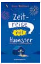
Al Chaudhury, Zeitreise mit Hamster , Coppenrath

„Al Chaudhury nimmt den Leser mit auf ein herrlich verrücktes Abenteuer durch die Zeit