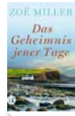
Zoë Miller, Das Geheimnis jener Tage , Insel

„Im September 1980 stürzt sich an der Küste von Cork ein junger Mann in die Fluten des